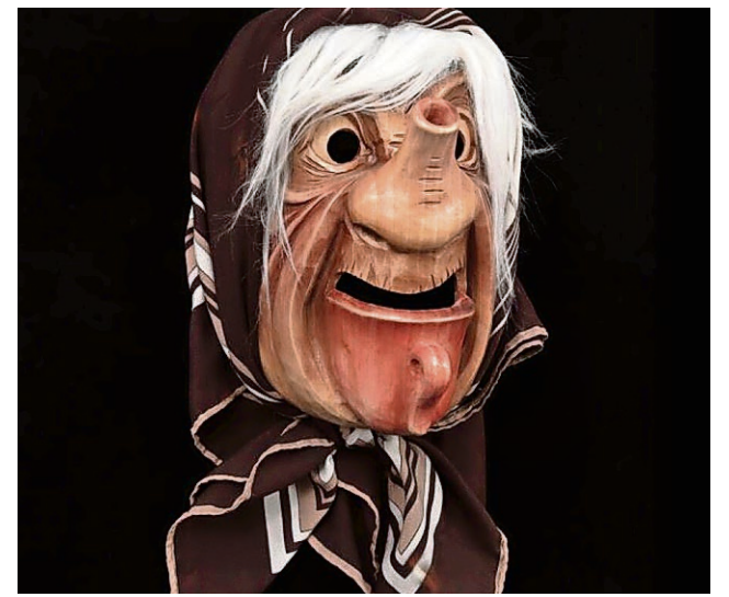
Eine zeitgenössische Charaktermaske ist die Kafitante von Josef Schnyder.