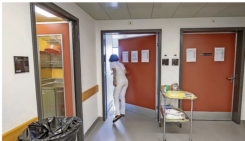
Das Luzerner Kantonsspital lockert das Besucherregime – auf der Covid-Station ist Besuch aber weiterhin verboten.

Neben diesen typischen Krienser Fasnachtscharakteren gibt es eine Vielzahl von Charakterfiguren, so das Eierrösi, das Gscheerlisi, die Kafitante oder der Chorber. sda